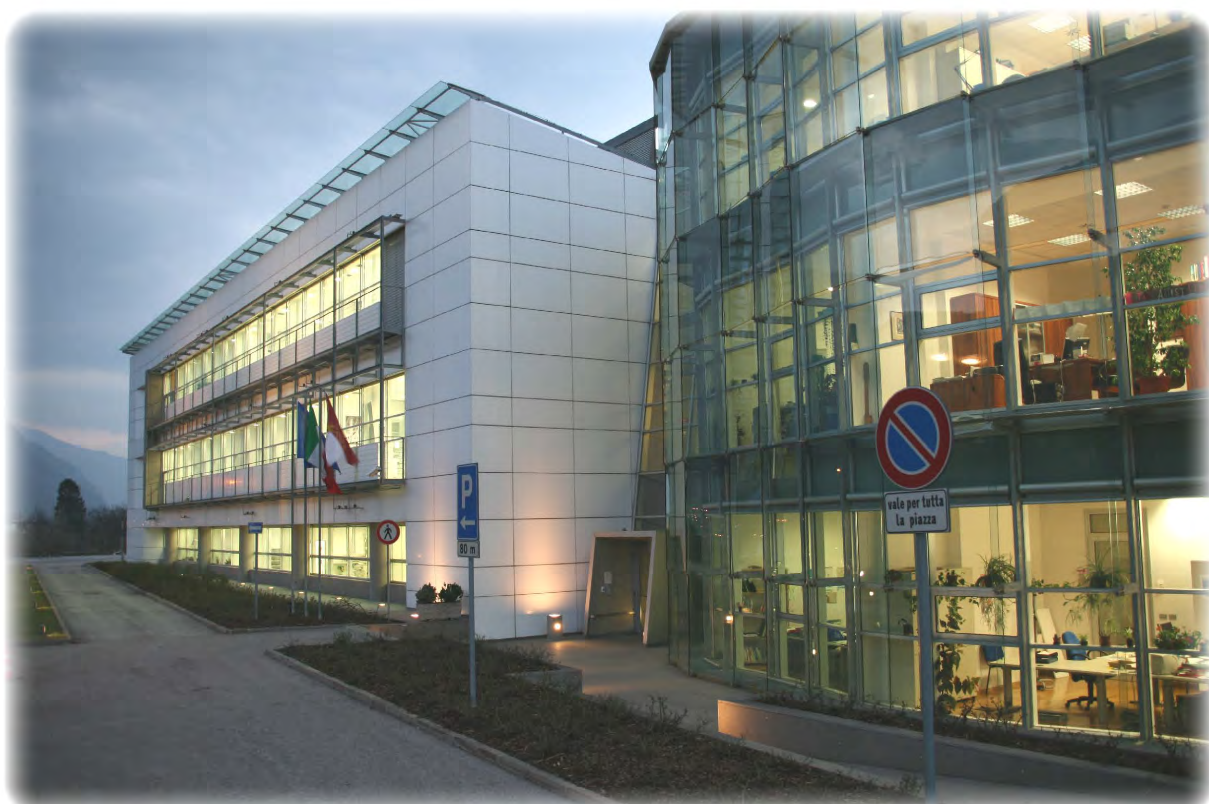
Agenzia provinciale per la protezione dell'ambiente