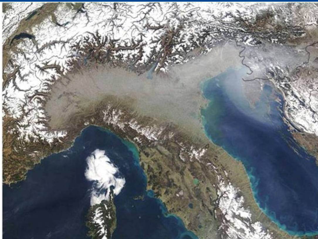
Figura 69 - Ortofoto dell'area del Bacino Padano

Nonostante la Provincia di Trento presenti una situazione generalmente meno critica rispetto ad altre zone dell'area in termini di qualità dell'aria, con concentrazioni che negli anni recenti si sono ridotte in modo consistente portando ad un sostanziale rispetto degli standard di qualità dell'aria, permangono alcune criticità (concentrazioni di \text{NO}_2 da traffico, di \text{O}_3 e di benzo(a)pirene). Inoltre, il Trentino possiede caratteristiche orografiche che lo accomunano alle zone settentrionali di molte regioni del nord Italia (contesto montano, valli strette, ecc) e caratteristiche meteorologiche comuni alle regioni dell'area