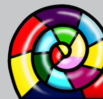
AGENZIA PROVINCIALE PER LA PROTEZIONE DELL'AMBIENTE