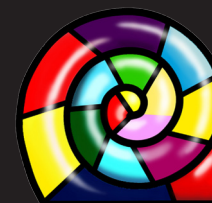
AGENZIA PROVINCIALE PER LA PROTEZIONE DELL'AMBIENTE